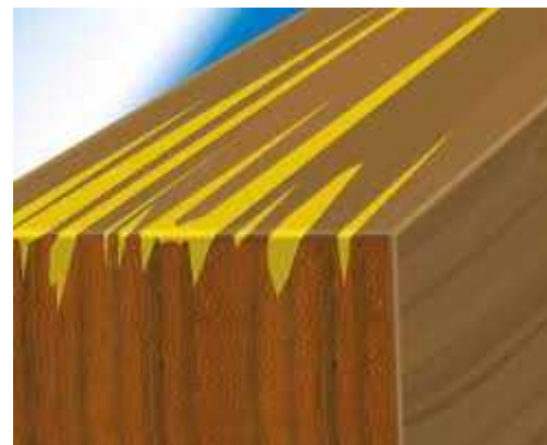
Zaliatie prasknutých drevených podkladov