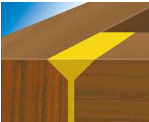
Lepenie rohových škár