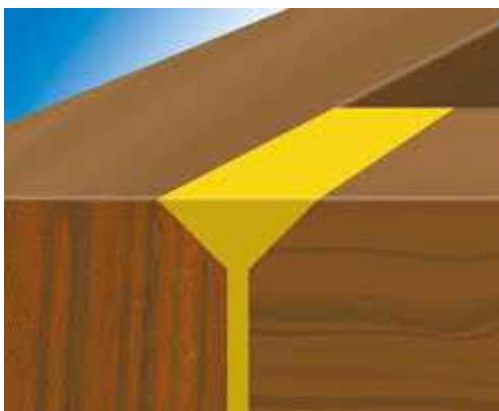
Lepenie rohových škár